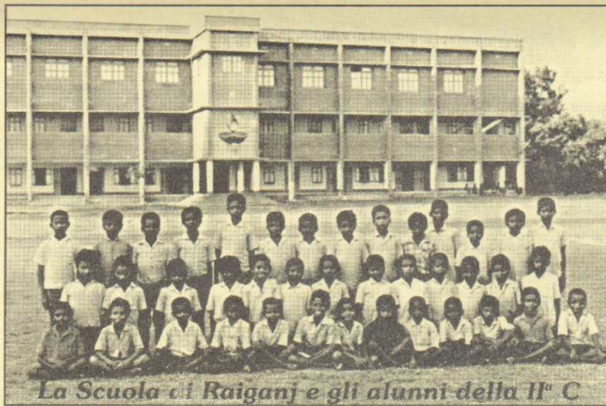
La Scuola di Raiganj e gli alunni della II a C