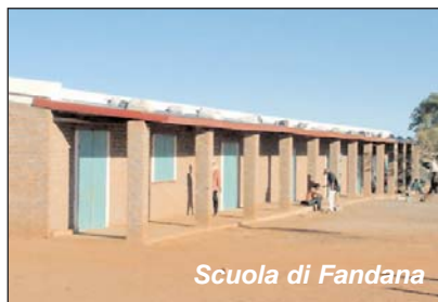
Scuola di Fandana

Davvero posso confermare che nella zona di Andonaka...il deserto continua a fiorire. Ma quante difficoltà e imprevisti ostacolano il cammino! La mancanza di piogge , i cicloni che distruggono abitazioni e raccolti. E ancora c'è il problema benzina , ora alle stelle. Un pieno per la jeep costa 600.000 Franchi malgasci (60 euro), mentre uno stipendio medio è di 250.000 FM. (25 euro). Come pensare di utilizzare le pompe per l'irrigazione, il trattore per arare, la ruspa per dissodare, per realizzare canali, strade... servirsi del camion per il trasporto del materiale, ecc.?