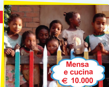
Mensa e cucina € 10.000