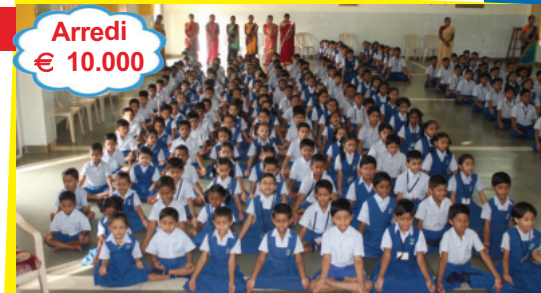
Arredi € 10.000