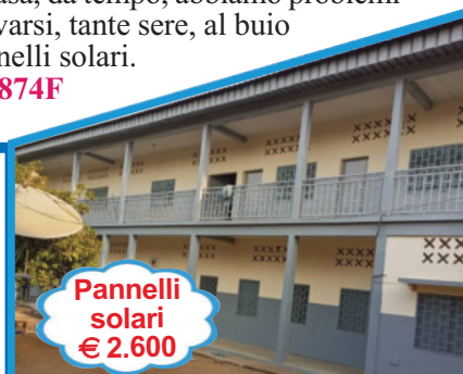
Pannelli solari € 2.600