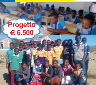
Progetto € 6.500