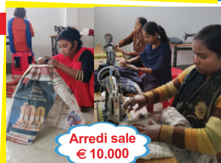
Arredi sale € 10.000