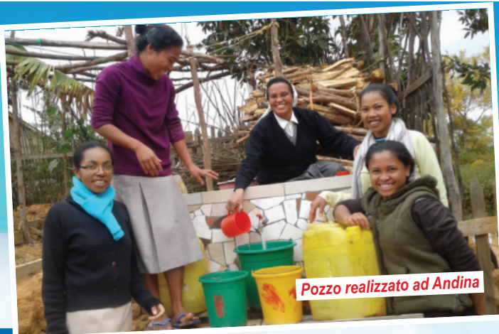
Pozzo realizzato ad Andina