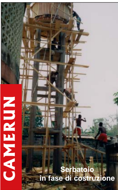
Serbatoio in fase di costruzione