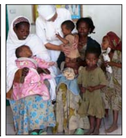
Un quintale di faffa