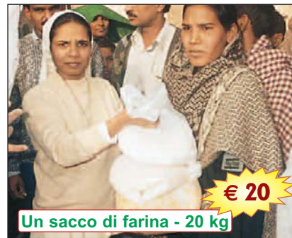
Un sacco di farina - 20 kg € 20