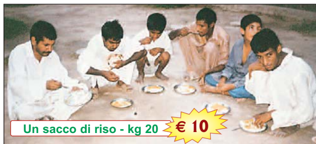
Un sacco di riso - kg 20 € 10