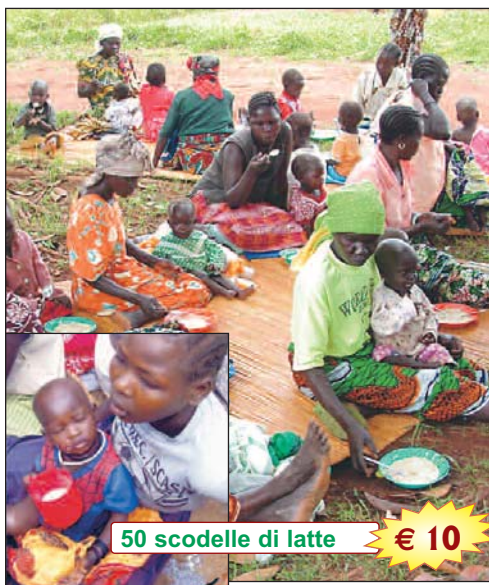
50 scodelle di latte € 10